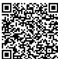
Prinsjesdagplannen 2022 Studiefinanciering